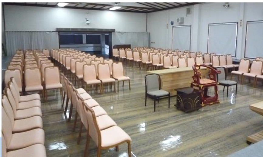
●式場内のイメージ