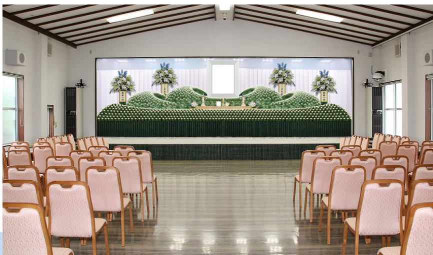
●式場内のイメージ