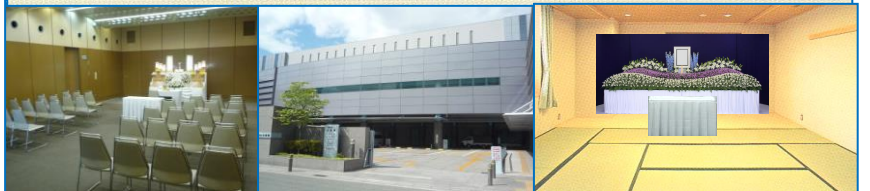
● 見取り図 中式場 外観 小式場