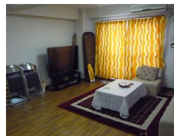
● 玄関 エントランス お控え室