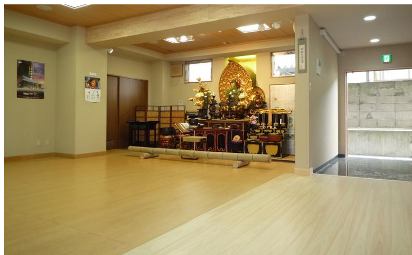
● 式場内のイメージ