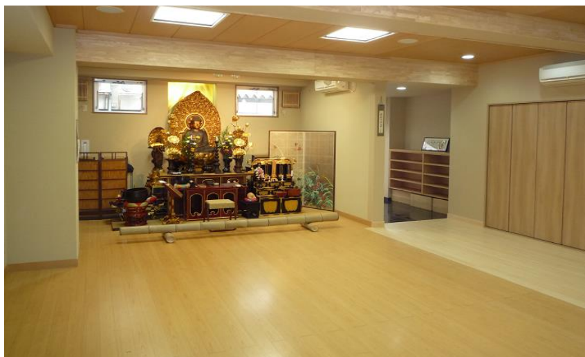
● 式場内のイメージ