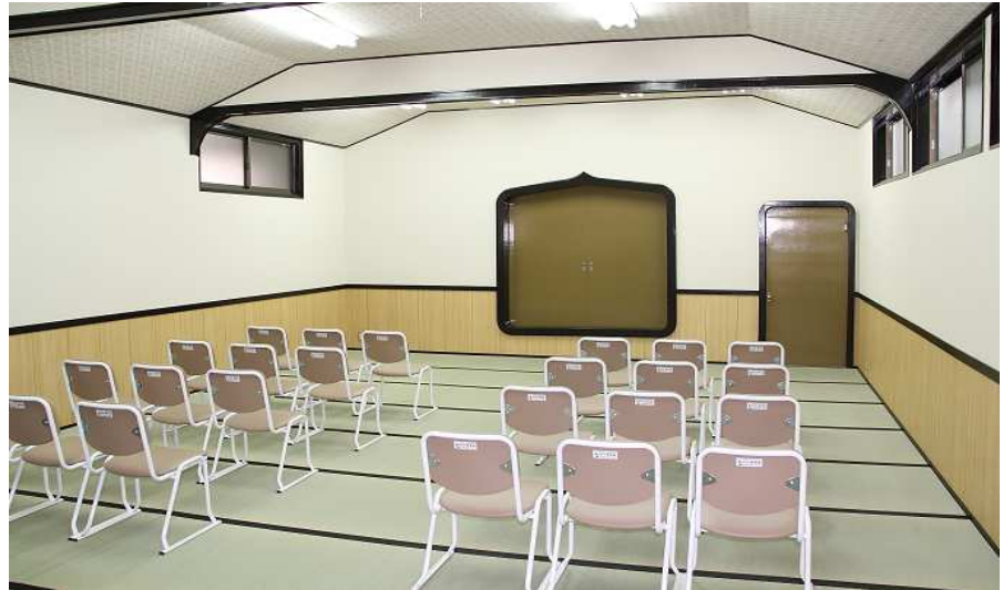
式場内のイメージ