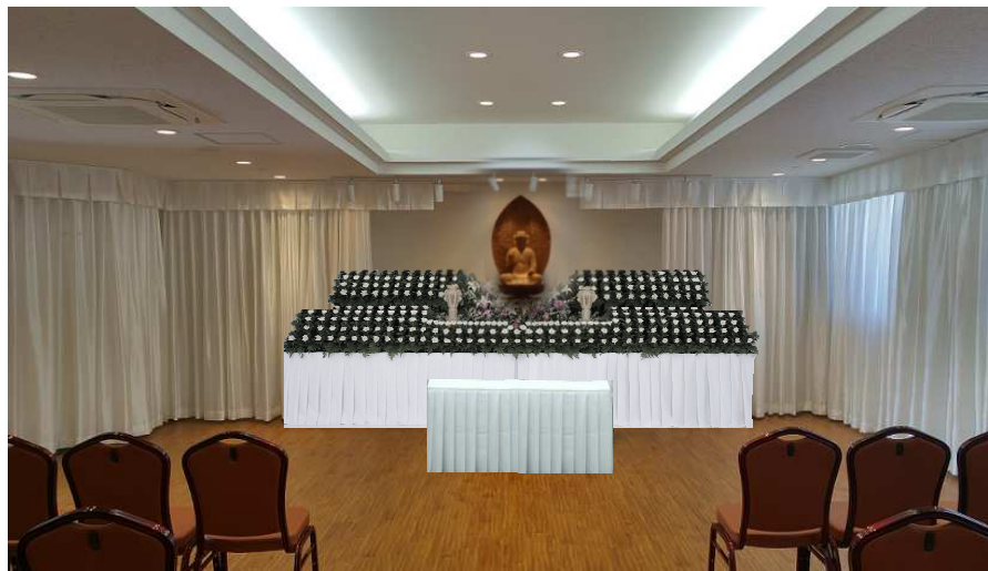
式場内のイメージ