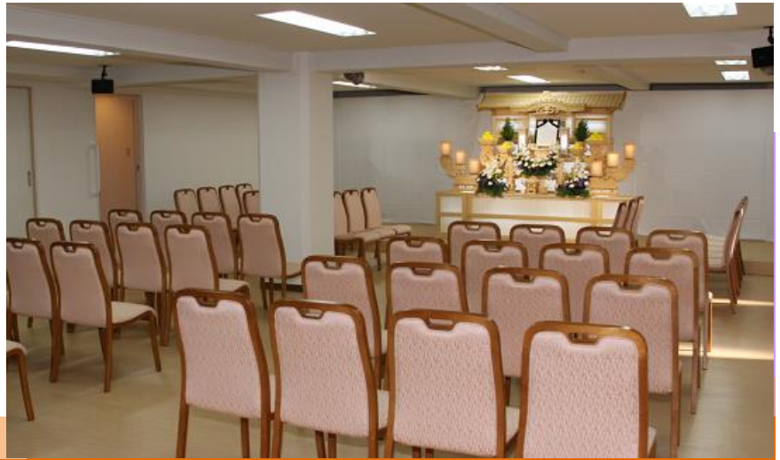
●式場内のイメージ