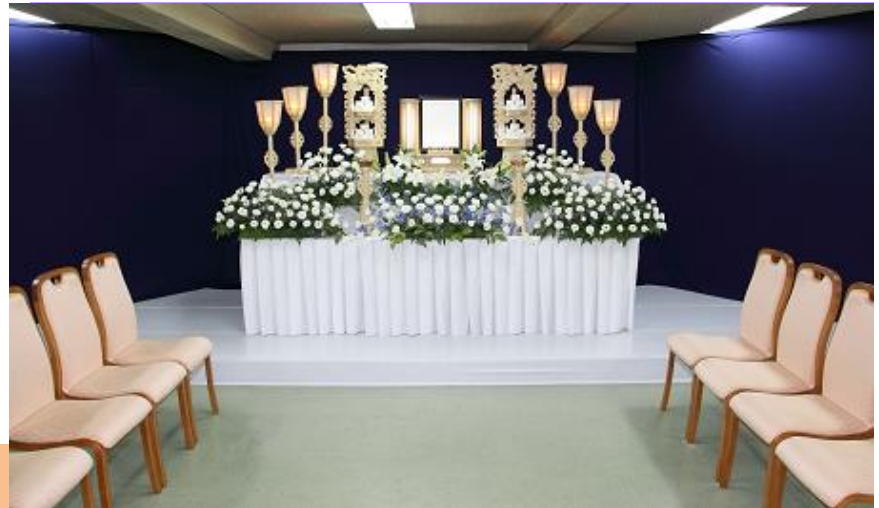
●式場内のイメージ