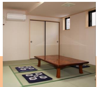
●外観 バスルーム お控え室2室