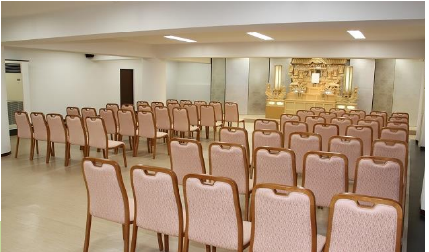
●式場内のイメージ