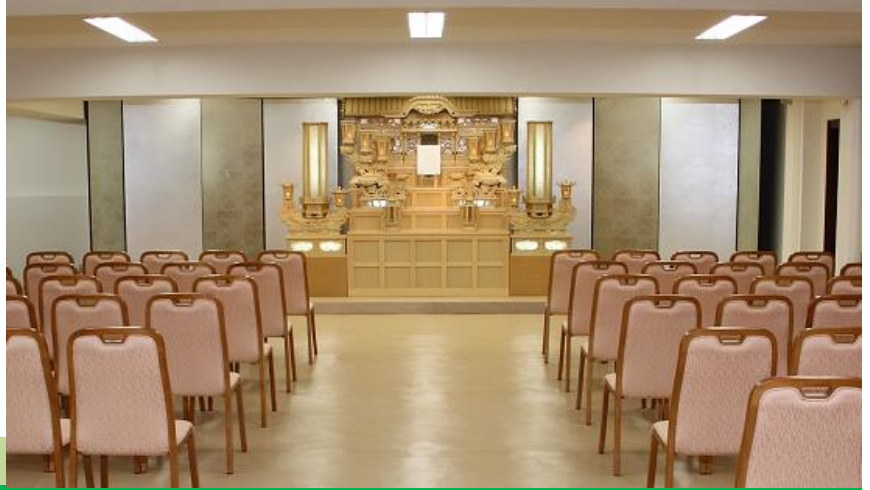
●式場内のイメージ