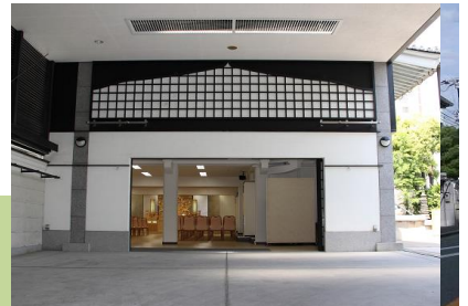
●表飾り お控え室2室 式場外観